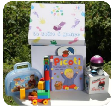
Boîte à malice : 15 mois ± à 2 ans ½