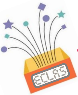
Valisette : de la naissance à 5 mois